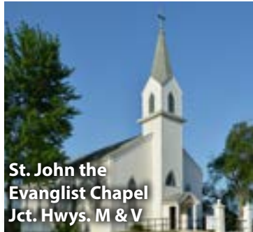
St. John the Evangelist Chapel Jct. Hwys. M & V