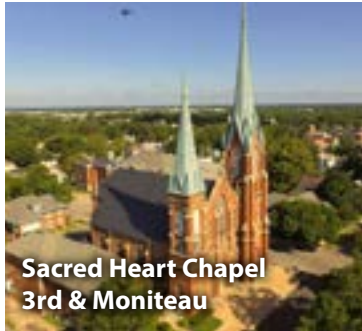
Sacred Heart Chapel 3rd & Moniteau