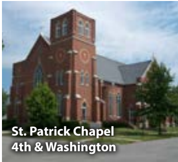
St. Patrick Chapel 4th & Washington

www.svdpparish.diojeffcity.org | 660-827-2311 | 660-826-2062