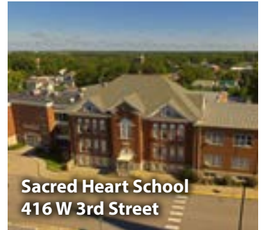
Sacred Heart School 416 W 3rd Street

WEEKEND MASS TIMES Saturdays 4:00pm at St. Patrick 7:30pm at St. John Sundays 8am and 10am at Sacred Heart 9am in English and 11:30am in Spanish at St. Patrick WEEKDAY MASS TIMES Tuesdays, Thursdays & Fridays 6:30am at St. Patrick 8:30am at Sacred Heart Wednesdays 8:30am at Sacred Heart 6:30pm (Spanish) at St. Patrick CONFESSIONS Wednesdays 5pm at St. Patrick Saturdays 9am-11am Sacred Heart and before Mass at St. John's First Sundays 9am at Sacred Heart 10am at St. Patrick 1pm at St. Patrick