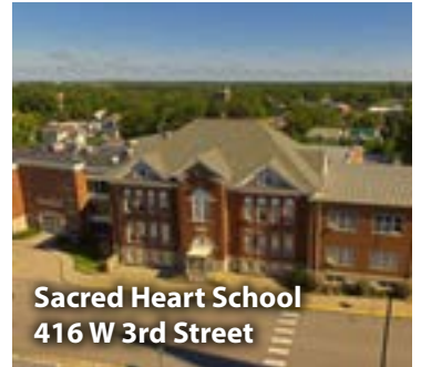
Sacred Heart School 416 W 3rd Street